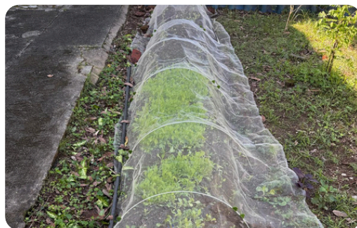
工作訓練及園藝治療