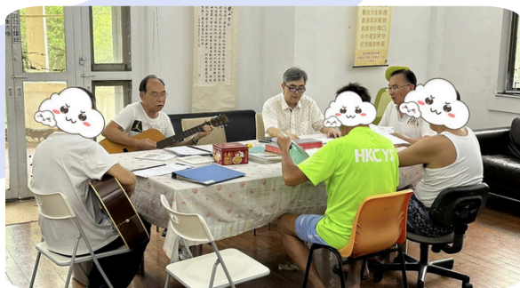
日常的靈修和聖經分享